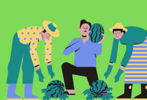
Descenso de la productividad de las cosechas.