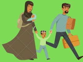
Desplazamientos de poblaciones enteras.