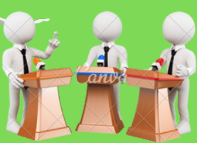
Mas conflictos bélicos para acceder a recursos limitados.