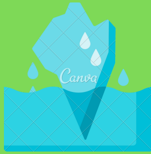
Deshielo de glaciares