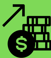
Subida de precios en alimentos básico o consumo habitual.