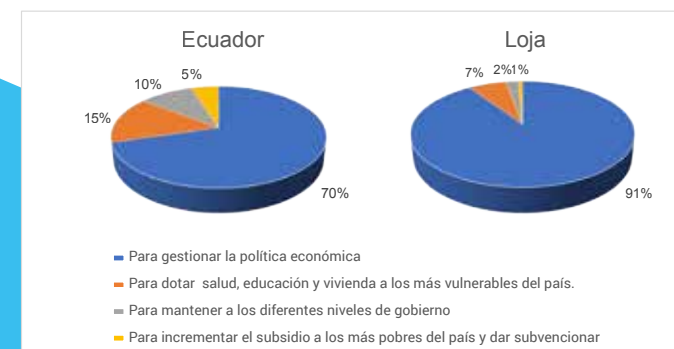
Figura 2. ¿Para qué sirven los tributos recaudados por el Estado?:

Por ende, se observa que a nivel de estas interrogantes, los ciudadanos de las empresas de la provincia de Loja, manifiestan tener un conocimiento mayor con respecto a la cultura tributaria.